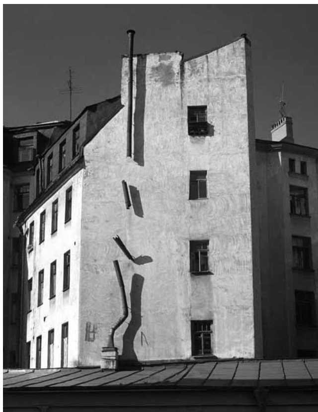
Застывшее падение, 1989