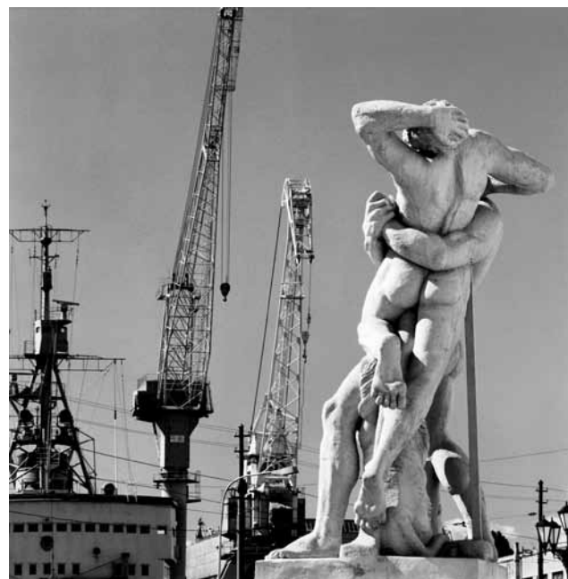
Свидетели поединка, 1999

*работы могут быть предоставлены без рам (паспарту).